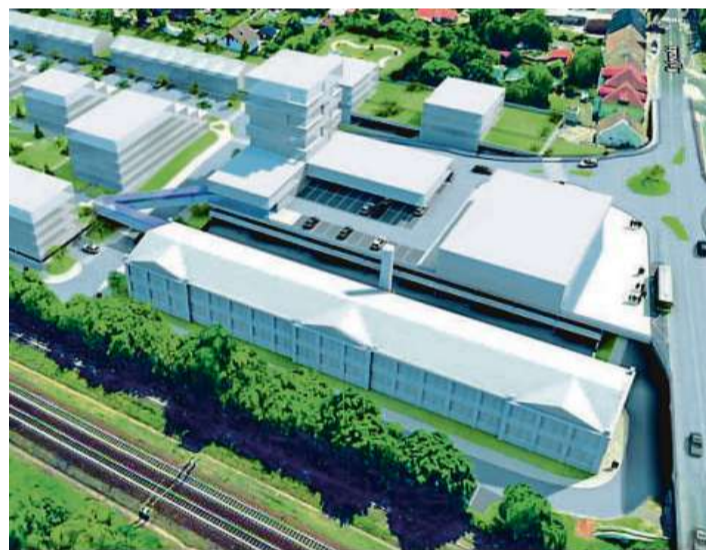
Dopravní napojení Výhodou nabídky firmy bylo to, že zaplatí a vybuduje i dopravní napojení na ulici Kyjevskou nedaleko nemocnice. Studie: Linkcity

„Převod areálu na Linkcity má dvě zásadní odkládací podmínky - firma musí mít vydané pravomocné územní rozhodnutí a stavební povolení na dopravní napojení celého areálu. Výhradně po jejich splnění bude areál převeden na Linkcity. Po převodu pak musí firma do čtyř let přestavět minimálně 75 procent areálu,“ dodala Koubková.