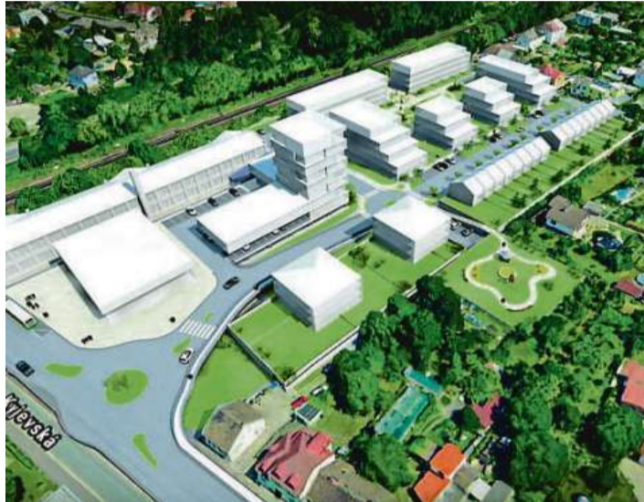
Hlavně byty Firma Linkcity, která třeba postavila bytový dům v Pernerově ulici v centru Pardubic, bude stavět další bydlení v bývalé Tesle.

Město areál nejprve pronajme a následně prodá nejméně za základní cenu ve výši 35 milionů korun společnosti Linkcity, která zvítězila ve výběrovém řízení. V případě, že